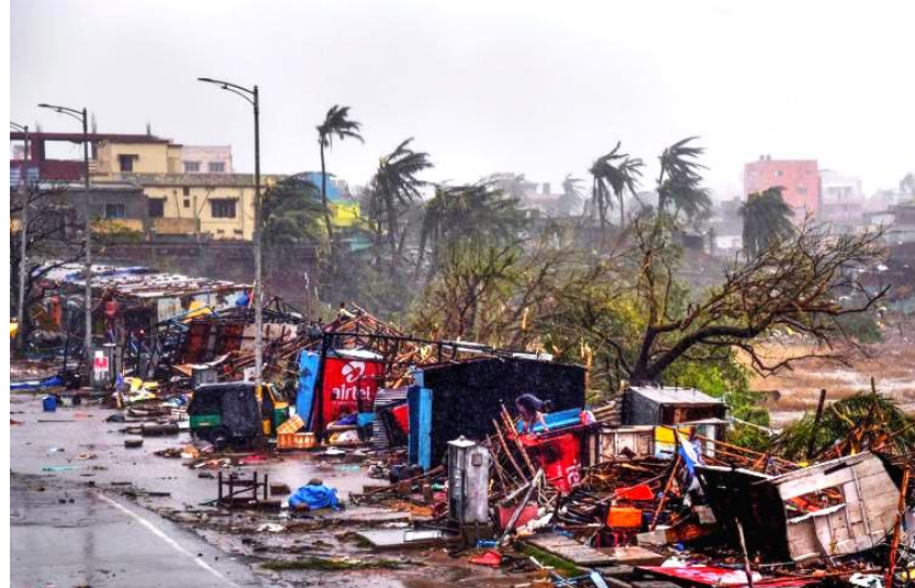
Cyclone Fani – Odisha (2019)