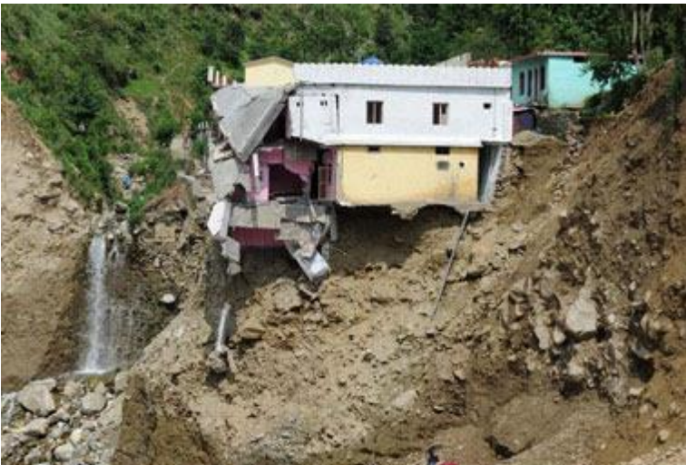
Landslide – Uttarakhand (2013)