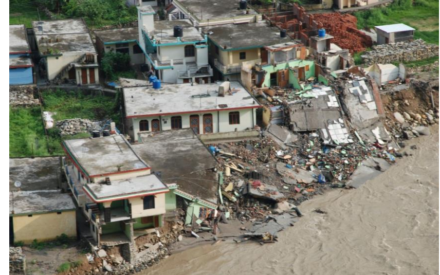
Floods – Uttarakhand (2013)