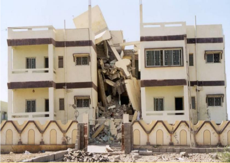
Earthquake – Bhuj (2001)