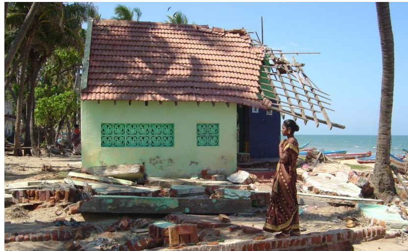
Tsunami –Tamil Nadu (2004)