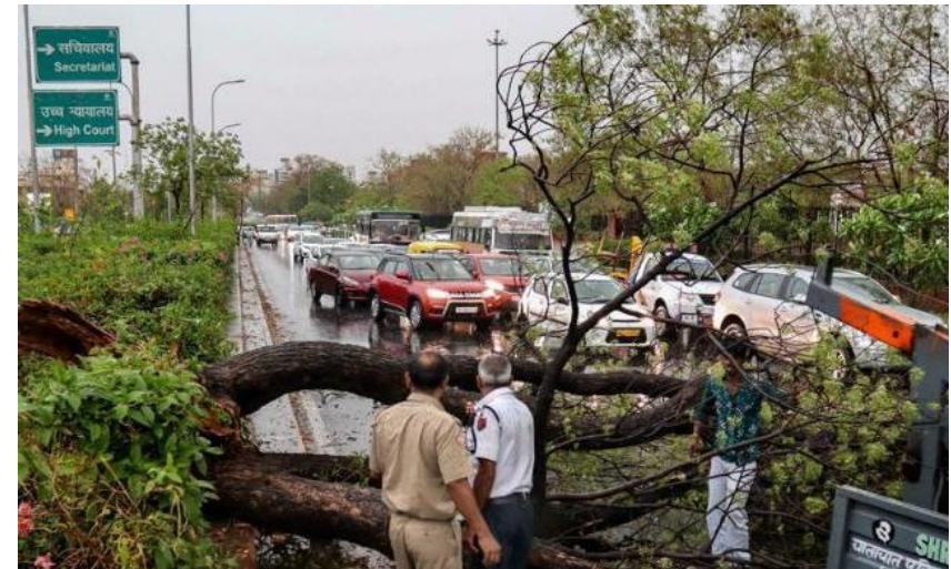
Thunderstorm – Jaipur (2019)